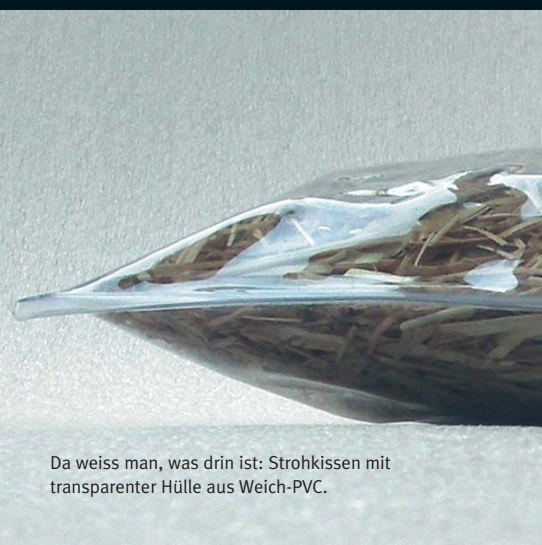
Da weiss man, was drin ist: Strohkissen mit transparenter Hülle aus Weich-PVC.

Ob Schwarzwälder Kirschtorte oder köstliche Sorbetbällchen: Die Schmuckstücke der Perlenköchinnen machen garantiert Appetit.