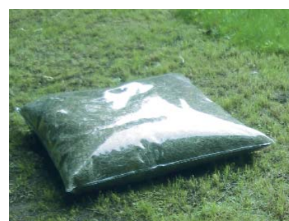
Frisch gemäht und abgefüllt: So viel Natur tut gut.

Kissen mit Stoffbezug gehören zu den Klassikern in heimischen Wohnzimmern. Doch meistens verraten die Hüllen nichts über ihren Inhalt. So bleibt die Füllung ein grosses Geheimnis. Viel Durchblick bieten Kissen mit transparenter Hülle. Eine Ummantelung aus weichem PVC schafft tiefe Einblicke.