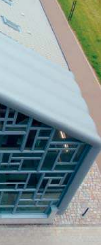
Stimmige Fassadenoptik: beschichtete Kunststoff-Profile und PVC-Dachbahnen, die das Fenster-Mosaik einrahmen.