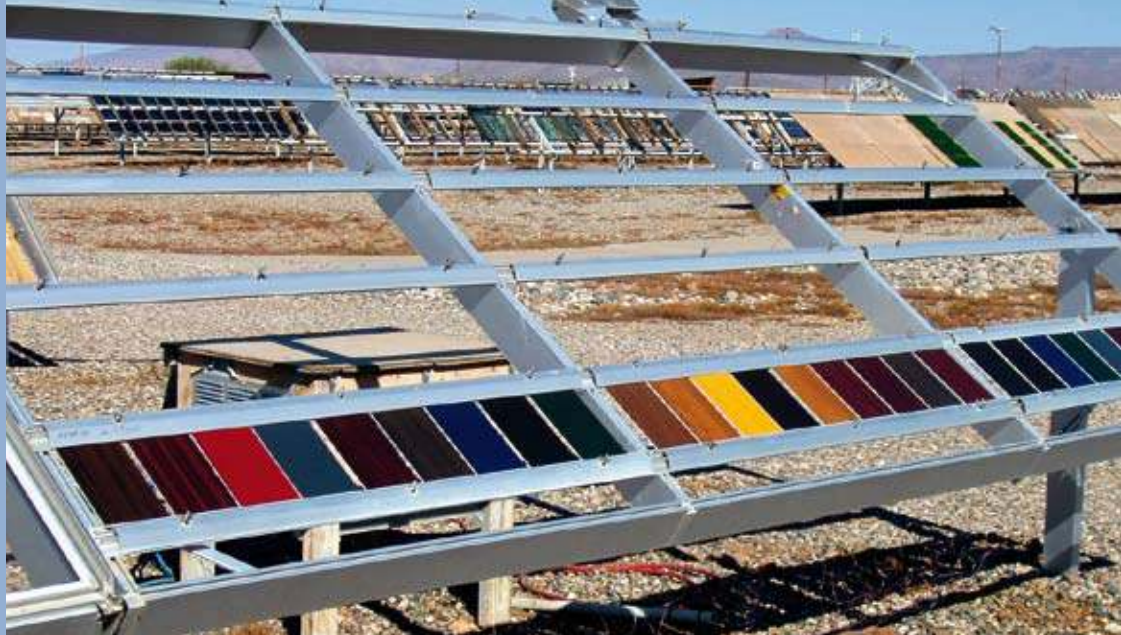
Wüstengrill: RENOLIT-Folien mit SST im Langzeittest unter der gnadenlosen Sonne von Arizona.

„Den grössten Fortschritt haben wir naturgemäss im Zusammenhang mit dunklen Farbstellungen und Holzdekoren verzeichnet“, fasst Dr. Heukel-