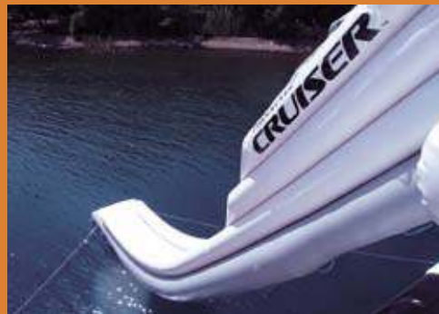
Ganz schön hoch so eine Rutsche. Der steile Winkel von 45 Grad verspricht ein rasantes Freizeitvergnügen.

Wer sich mit einer Luxusyacht über die Weltmeere bewegt, liebt die Abgeschiedenheit auf dem Wasser. Doch für die notwendige Abwechslung an Bord sollte auch gesorgt sein. Ein Beispiel dafür sind die beeindruckenden Wasserrutschen von Freestyle Cruiser aus Florida, mit der Passagiere aus bis zu 18 Metern Höhe in das blaue Nass rasen können. Jede dieser aufblasbaren Rutschen ist eine Massanfertigung und wird ganz nach Kundenwunsch gestaltet. Das betrifft nicht nur die Farbauswahl des extrem widerstandsfähigen PVC-Materials, sondern auch die Verlaufsform der Rutsche, die sowohl in gerader als auch in S-Form realisierbar ist. Selbst die Bedruckung der PVC-Platten mit einem Logo ist machbar. Bis zu einer Höhe von fünf Metern kommen die aufgeblasenen Schnellbahnen dank ihrer eigenen Stabilität und robuster Halteseile ohne