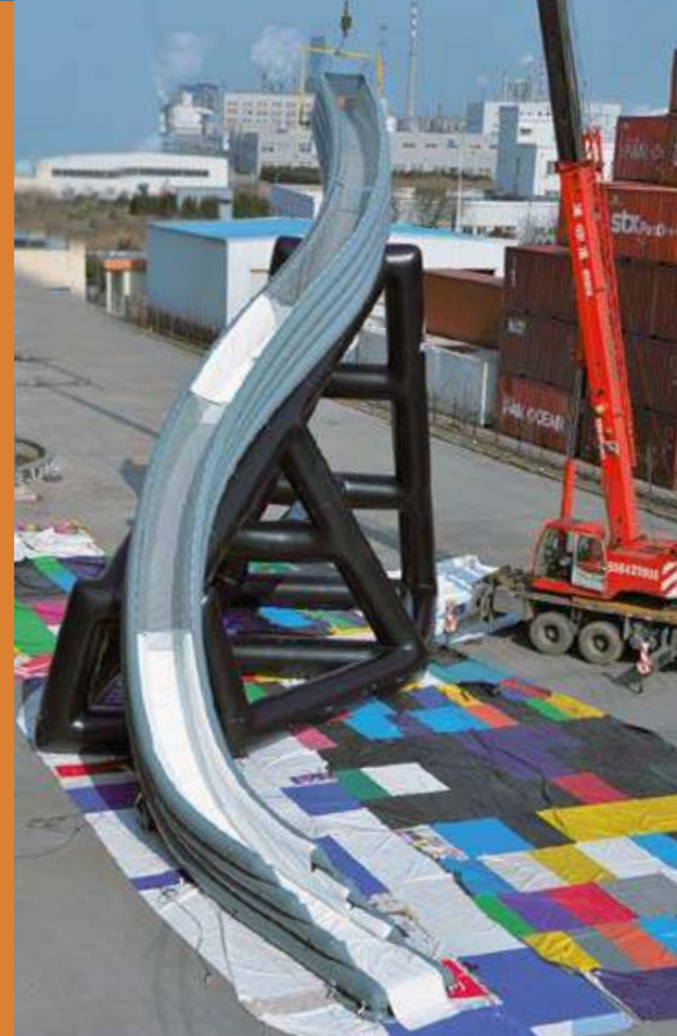
Diese geschwungene Rutsche von Freestyle Cruiser wurde an einer 70-Meter-Yacht angebracht. Ihre Stabilität erhält die 12,6 Meter lange Rutsche durch eine aufblasbare Stützkonstruktion.

Neuester Coup von Freestyle Cruiser sind zwei baugleiche Rutschen in geschwungener Form, beide für den Einsatz auf einer 70-Meter-Yacht produziert. Mit einer Länge von je 12,6 Metern beträchtliche Exemplare für einen ausgiebigen Geschwindigkeitsrausch. Hier ist ein gutes Quäntchen Mut notwendig, um den Weg nach unten anzutreten.