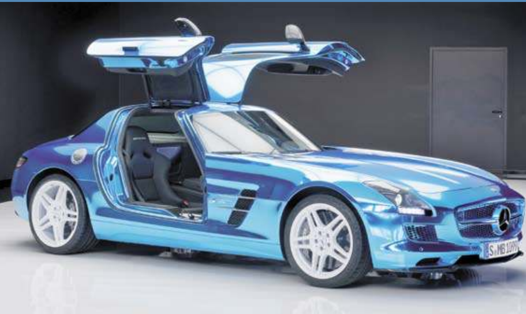
Atemberaubendes Design: Den spiegelnden Chromeffekt erzielten die Spezialisten von INTAX, indem sie drei exakt aufeinander abgestimmte PVC-Folien auf den Sportwagen brachten.

sie sich jeder noch so filigranen Kontur exakt anpassen. Sie eignen sich nicht nur für die Gestaltung individueller Boliden gleich welchen Herstellers und Modells. Der Folienüberzug ist auch gerade für die CI-gerechte Umgestaltung kompletter Fuhrparks sehr beliebt. „Zu unseren Kunden zählen unter anderem alle namhaften