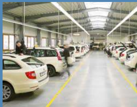
Klassische Anwendung für die ganzflächige Folierung von Fahrzeugen sind Taxi-Flotten.

ma entwickelte ursprünglich Lösungen für die rückrüstbare Umgestaltung eigener Funkmietwagen und beschäftigt heute mehr als 70 Mitarbeiter. Ein Grossteil davon gestaltet sowohl Automobile aus dem Individualbereich als auch