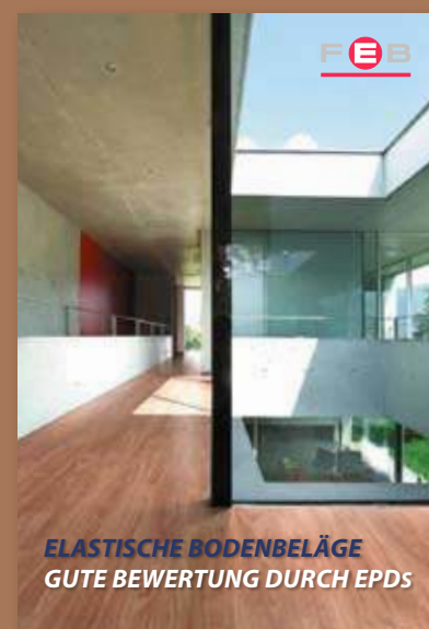
ELASTISCHE BODENBELÄGE GUTE BEWERTUNG DURCH EPDS

Einer Teilaufgabe dieser Starken Seiten liegt die Infoschrift „Elastische Bodenbeläge – Gute Bewertung durch EPDs“ bei. Wenn Ihre Ausgabe kein Heft enthält, dann können Sie Ihr persönliches Exemplar sofort nachbestellen. Die vom FEB-Fachverband der Hersteller elastischer Bodenbeläge e.V. herausgegebene Publikation entstand in enger Zusammenarbeit mit den FEB-Mitgliedsunternehmen und der PVCplus Kommunikations GmbH. Sie informiert nicht nur über die enorme Designvielfalt und die herausragenden technischen Eigenschaften elastischer Bodenbeläge. Sie stellt auch seriöse Bewertungssysteme wie neue Environmental Product Declarations (EPDs) vor, die Architekten und Planern zuverlässige Informationen an die Hand geben, damit sie sich für nachhaltige elastische Böden entscheiden können. Wer die Broschüre nicht als