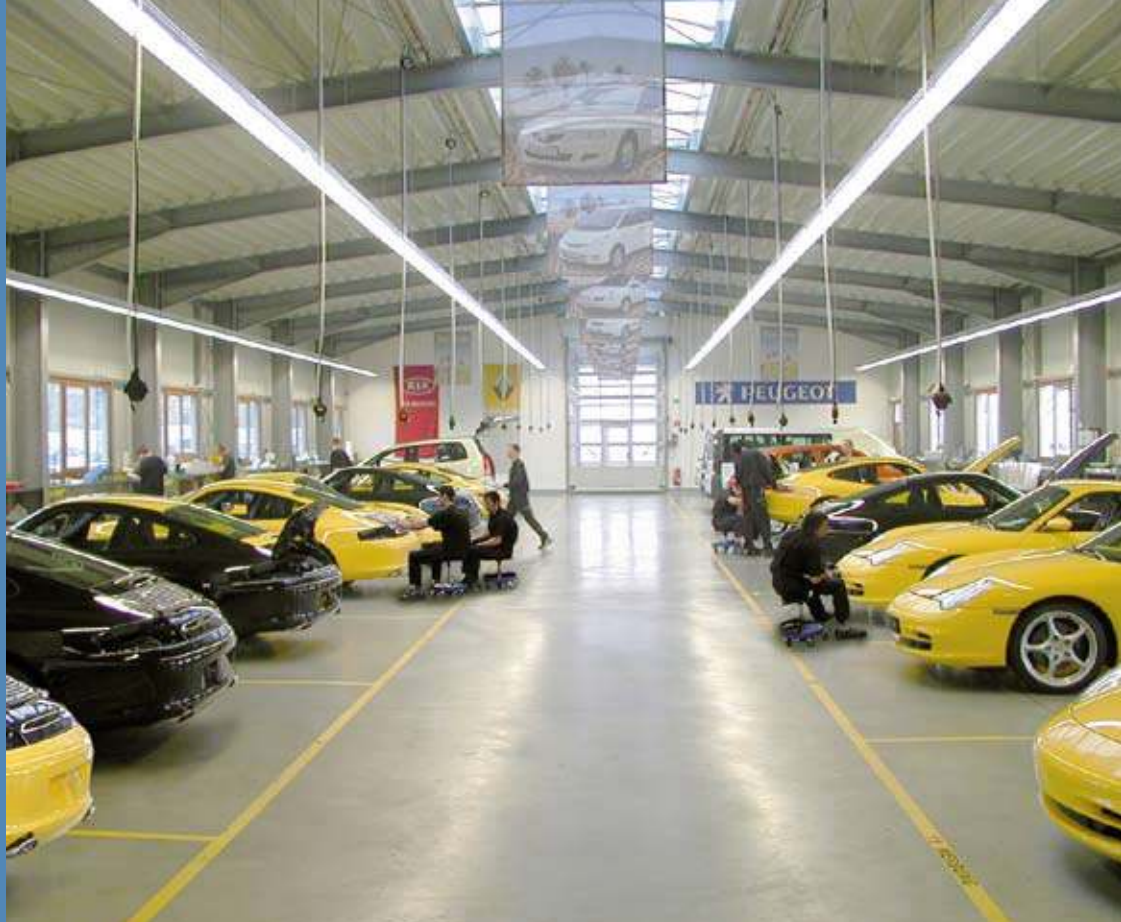
Etwa 1.500 Fahrzeuge erhalten in Oldenburg jährlich eine zweite Haut aus PVC-Folie: Auch Luxusportwagen wie der Porsche 911 gehören dazu.

Die Beklebung mit Folien ist nicht nur CI-gerecht und erhöht den Wiedererkennungseffekt der Fahrzeuge. Sie ist auch deutlich kostengünstiger als die wesentlich aufwändigere Lackierung. Und sie lässt sich später wieder rückgängig machen. So erhalten die Auftraggeber eine flottenkonforme Farbgebung auf Zeit und Einzelpersonen ein ganz individuelles Gefährt weitab