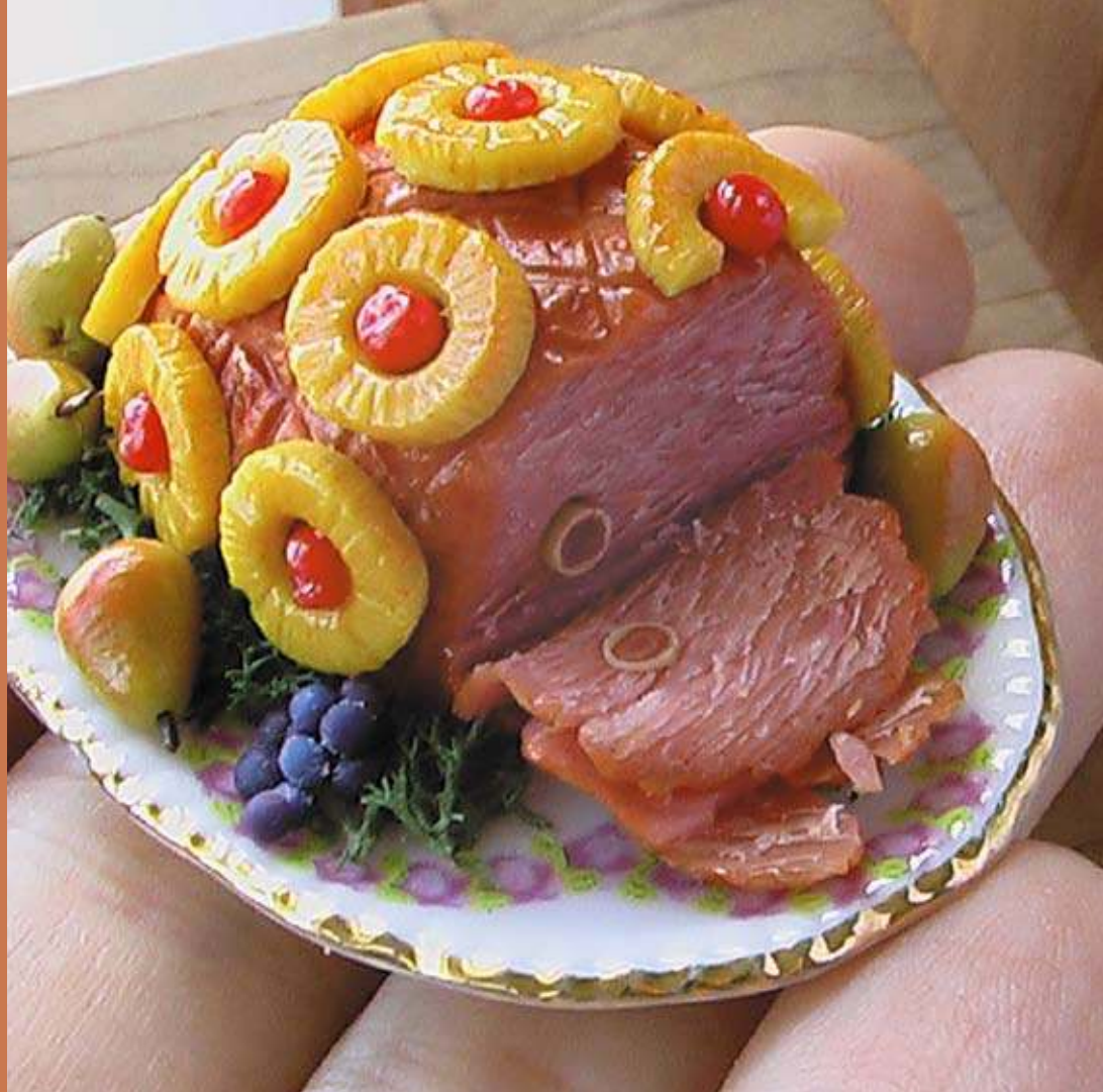
Wie winzig die Speisen-Arrangements von Mo Tipton sind, zeigt dieses Bild. Die Fleischplatte mit allen nachgebildeten Details wie Ananas und Kirschen ist nur etwas grösser als ein 2-Euro-Stück.

Die amerikanische Künstlerin aus Columbia (Missouri) verkauft ihre Miniaturen im Online-