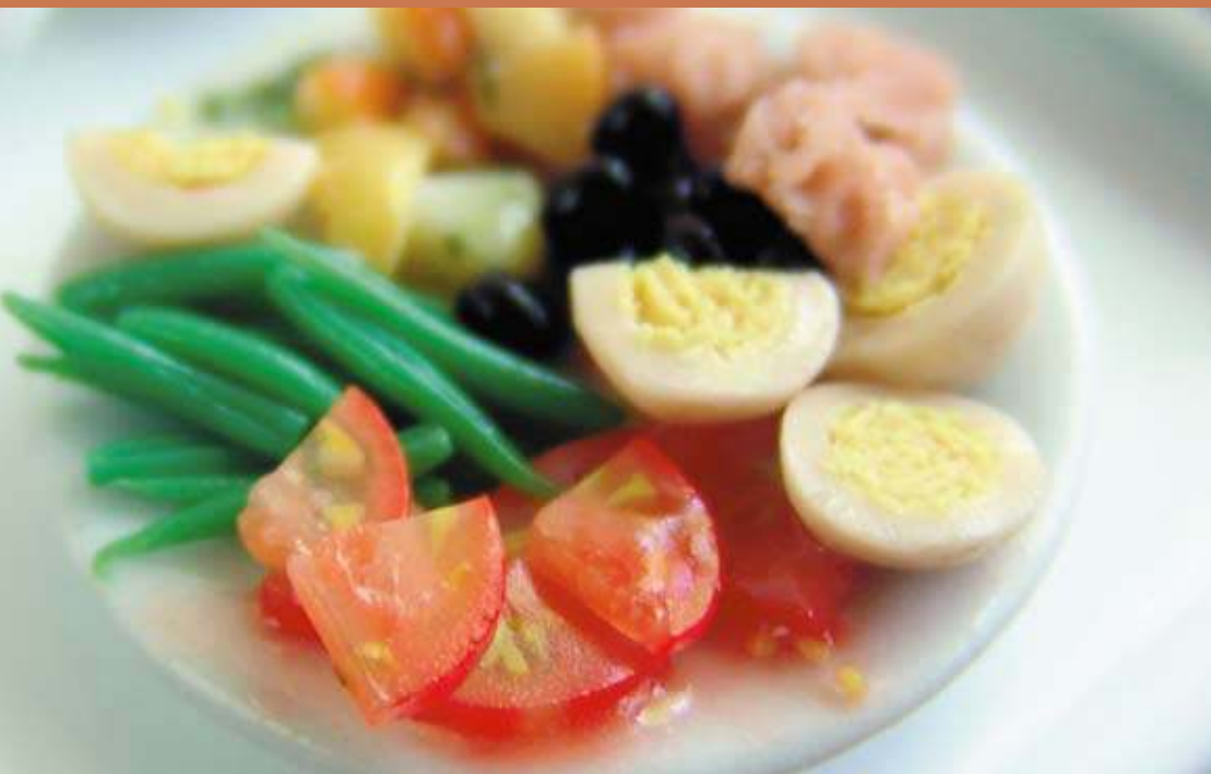
Diese kalte Platte aus Tomaten, Bohnen und Eiern passt ideal ins Esszimmer jeder Puppenstube.

trotzdem aussehen wie aus der Bäckerei, ist nicht nur ihrem perfekten Fingerspitzengefühl, sondern auch ihrer Ausbildung zur Konditorin zu verdanken.