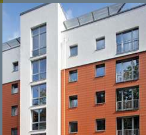
Die energiesparenden Inoutic Profile bei diesem Wohnprojekt in Duisburg tragen erheblich zur Dämmung der Gebäudehülle bei.