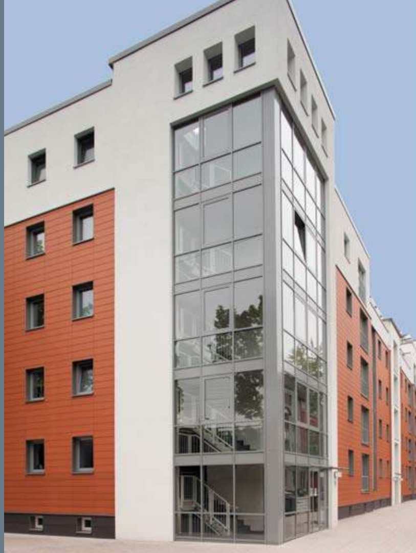
Modernes Gesicht: Wärmedämmende Fenstersysteme von Inoutic mit schmalen Profilansichten prägen die Fassade des neuen Wohnquartiers in Duisburg.

Besonderes Augenmerk legte das städtische Immobilienunternehmen mit seinen inzwischen 14.000 Wohnungen auf den Einsatz innovativer Heiztechnologien. Eine Wärmepumpen-Anlage produziert mittels Geothermie etwa 95 Prozent des Jahresbedarfs an Heizwärme