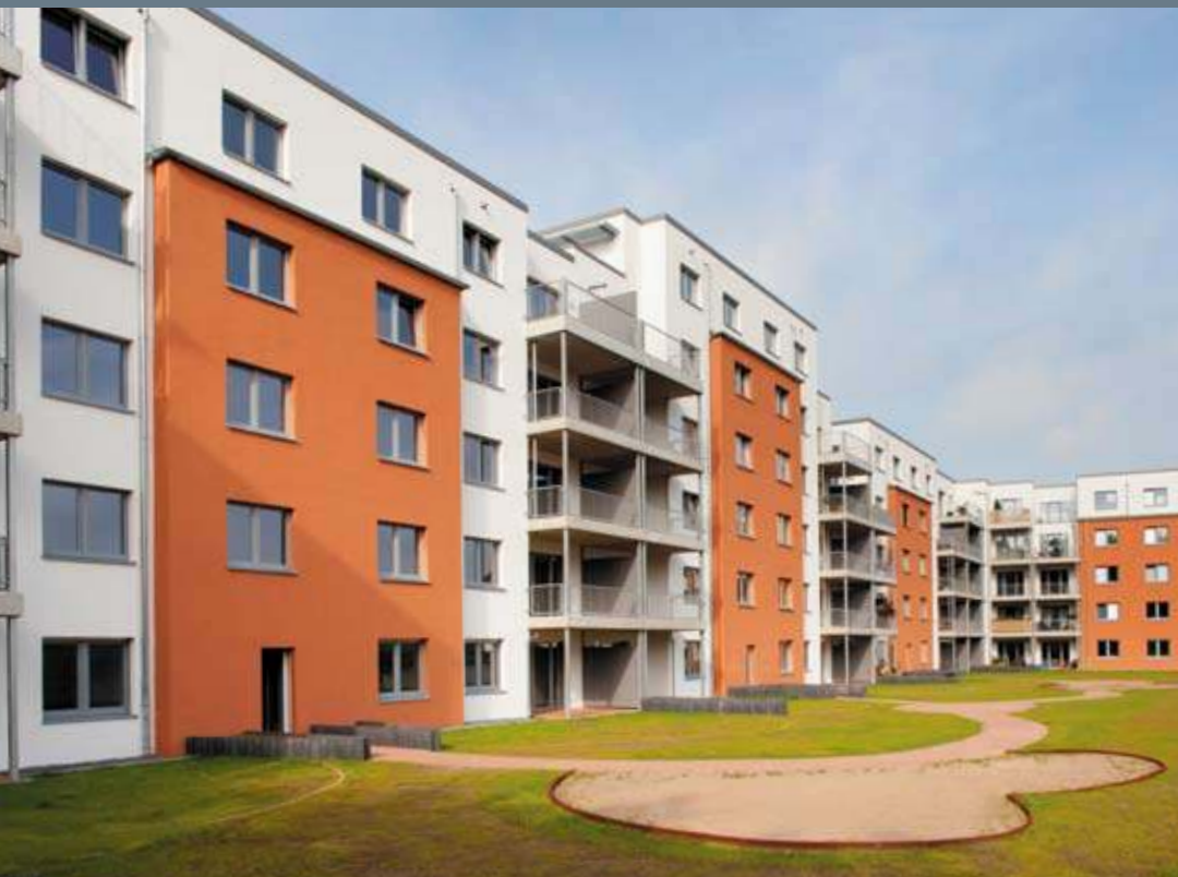
Mehr als 50 Wohnungen hat die GEBAG Duisburger Baugesellschaft im Herzen des Ruhrgebiets errichtet. Der begehrte Wohnraum bietet alle Vorteile einer zentralen Innenstadtlage.

darüber hinaus nahe gelegene Parks und der Botanische Garten. In diesem attraktiven Umfeld hat die GEBAG Duisburger Baugesellschaft einen Gebäudekomplex mit mehr als 50 neuen Wohnungen geschaffen.