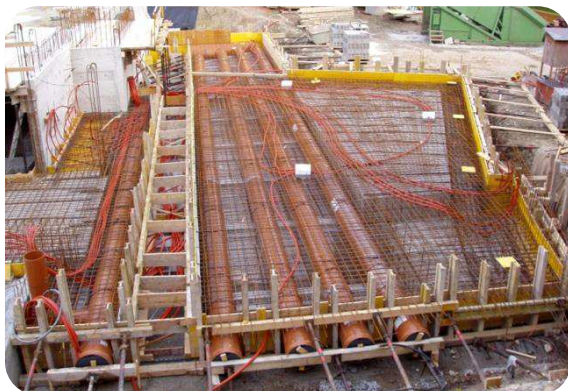
IMD Business School in Lausanne

Immer häufiger werden PVC-Kanalrohre auch zur Konstruktion von Lüftungsanlagen verwendet. Weil die Leitungsführung meist verwinkelt ist, müssen viele Bögen und Abzweiger auf kleinstem Raum installiert und miteinander verbunden werden. Solche komplizierten Elemente mit höchsten konstruktiven Anforderungen werden im Werk vorgefertigt und dann auf der Baustelle ohne weiteres Schneiden und Anpassen zusammengefügt. Solche Elemente werden von Experten für den Einsatz in Minergie-Gebäuden empfohlen.