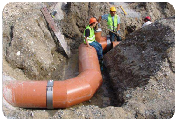
Phillip Morris International in Neuchâtel

Leitungsquerschnittes (bis zur Ellipse) unter Erhalt der Durchflussmenge vor und nach dem Hindernis. Diese hohen Anforderungen waren nur durch das Zusammenspiel von vielfältigen Produkteigenschaften, grosser Ingenieurserfahrung und handwerklichem Können der Konstrukteure möglich