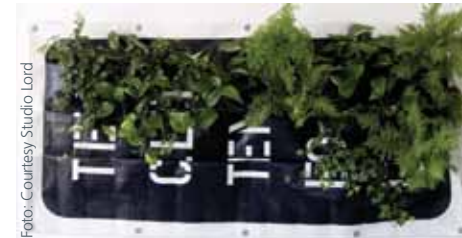
WallGreen, ein vertikaler Garten aus PVC-Bannern

Nachhaltige Zusatzstoffe: VinylPlus wird den Einsatz von PVC-Additiven untersuchen und die Verwendung von nachhaltigen Additiv-Systemen forcieren.