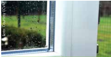
Kunststofffenster tragen zur Ressourcen- und Energie-Schonung bei

Nachhaltiger Energie-Einsatz: VinylPlus wird helfen, die Klimaauswirkungen durch die Reduktion des Energie- und des Rohstoff-Einsatzes zu minimieren, wobei der Umstieg auf erneuerbare Energien und Rohstoffe durch die Forcierung von Innovationen in diesem Bereich angestrebt wird.