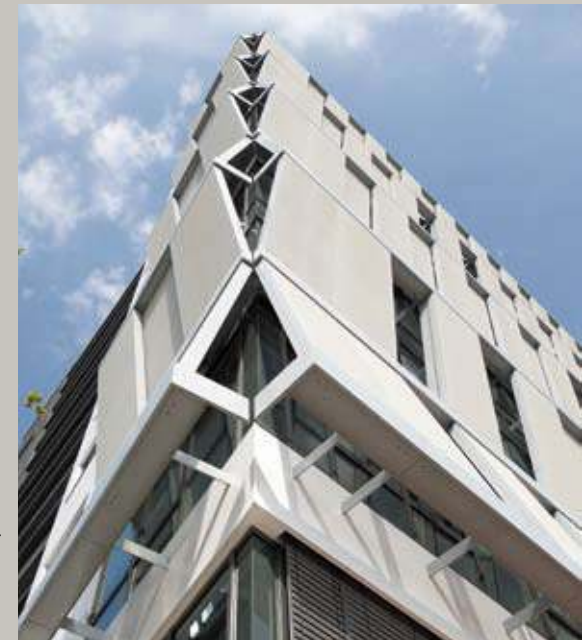
Blick von der Seite auf die Sonnenschutzzelemente mit ihren PVC-beschichteten Membranen.

Raumüberhitzung. So ist es möglich, die Kühlleistung des Gebäudes zu reduzieren und Energie in beträchtlichem Umfang einzusparen. Schliesslich verbrauchen moderne gläserne Bürogebäude heute meist mehr Energie für die Kühlung im Sommer als für die Heizung im Winter. Eine Studie des Physibel-Instituts Maldegem/Belgien zeigt das enorme Einsparpotenzial durch den Sonnenschutz beim Energieverbrauch in Europa. Jährlich könnten 80 Millionen Tonnen CO 2 bei der Gebäudekühlung und 31 Millionen Tonnen CO 2 bei der Gebäudeheizung eingespart werden.