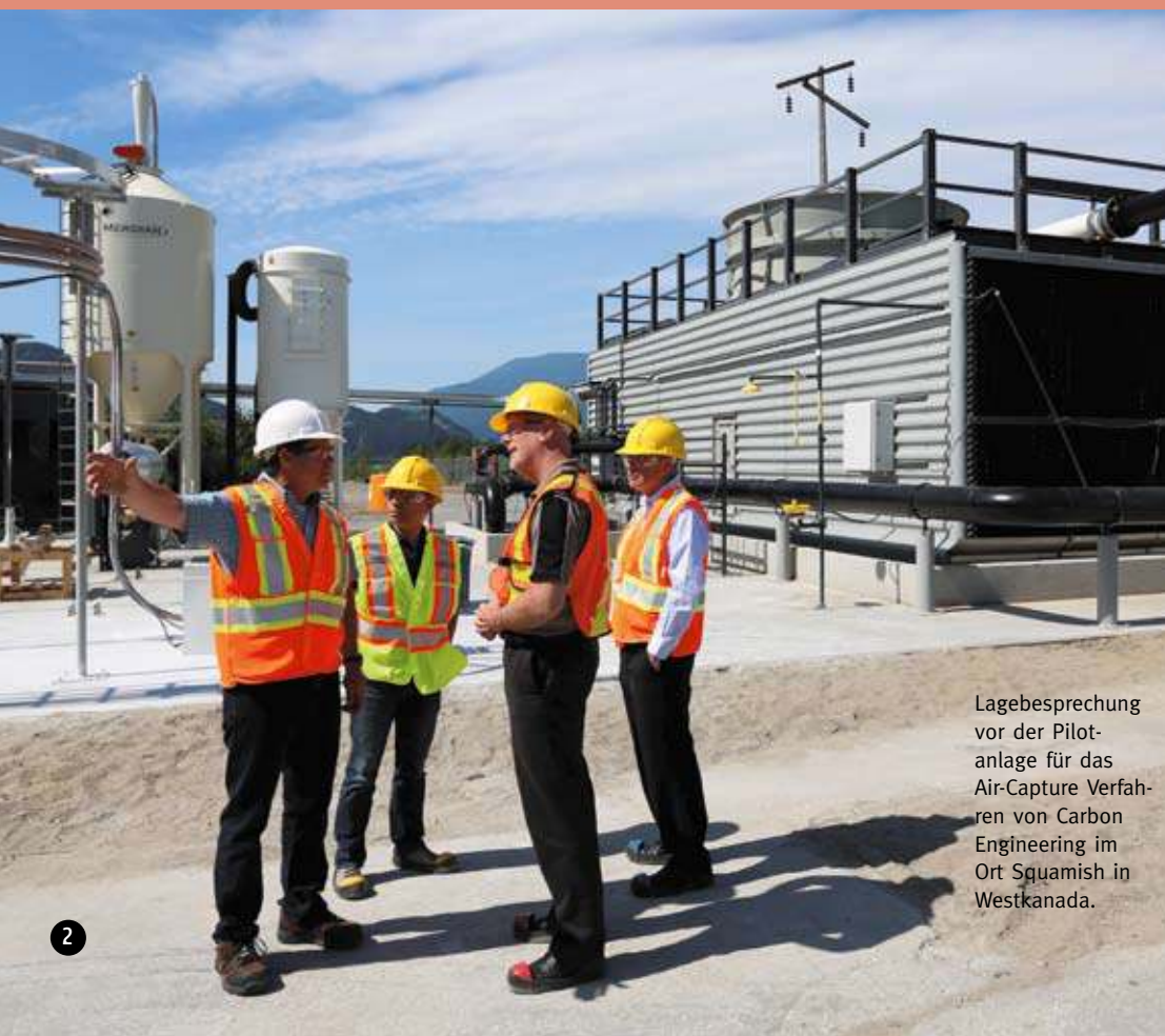
Lagebesprechung vor der Pilotanlage für das Air-Capture Verfahren von Carbon Engineering im Ort Squamish in Westkanada.