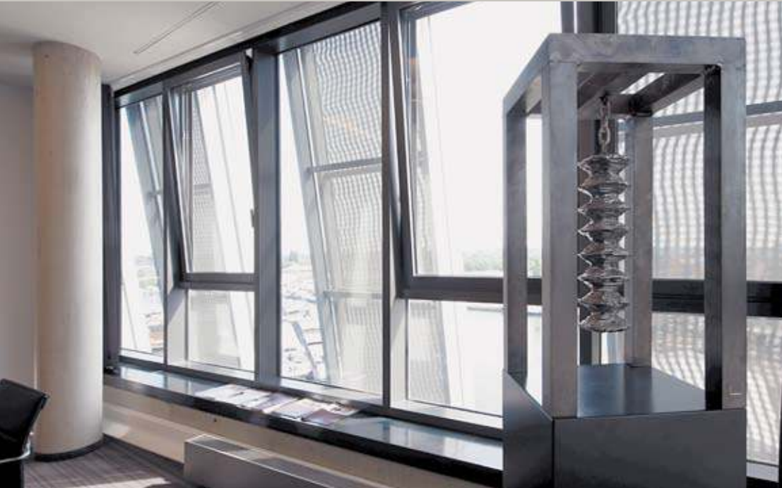
Durch das Netzgittergewebe der Sonnenschutzläden fällt noch genug Tageslicht in die Büroräume.

Der Harburger Binnenhafen gilt als „kleine Schwester der HafenCity“ und gehört zusammen mit dem historischen Stadtteil Harburg zum neuen Quartier „Channel Hamburg“. Er ist neben den Stadtteilen Wilhelmsburg und Veddel Teil des Präsentationsgebietes 2013 der Internationalen Bauausstellung Hamburg. Ihr Ziel ist es, das Hafensareal mit seiner attraktiven innenstadtnahen Lage auch für die Wohnbevölkerung zu erschliessen und neue Freizeitangebote zu schaffen. Dabei soll