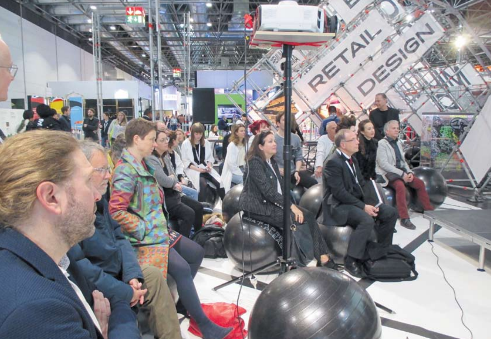
Reges Interesse zeigten die Messebesucher am Lebensmitteleinzelhandel der Zukunft und dem Konzept „Premium City“, das 50 Studierende des Studiengangs Retail Design an der HSD University auf der EuroShop 2020 realisiert hatten.